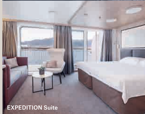
VON OBEN: ©KAY FOCHTMANN; ©MARIUS VIKEN; ©ESPEN MILLIS / HURTIGRUTEN